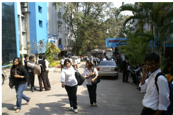
Symbiosis International University Vishwabhavan Campusの様子