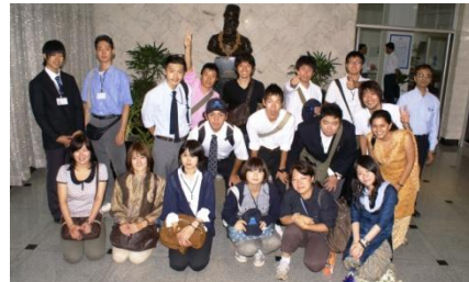
インド産業リサーチ(企業訪問)