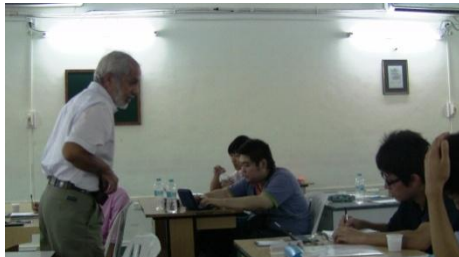
インド人講師による白熱教室