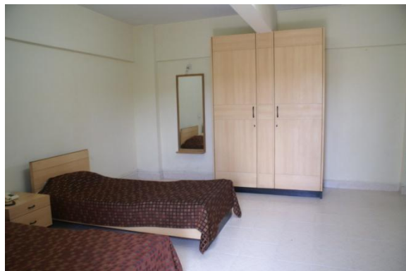
宿泊先はキャンパス内のゲストルーム